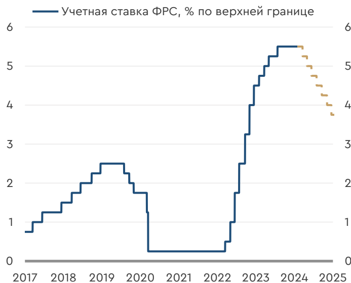
График. Ставка ФРС и ожидания ее динамики

Источник данных: ФРС, фьючерсы на ставку ФРС